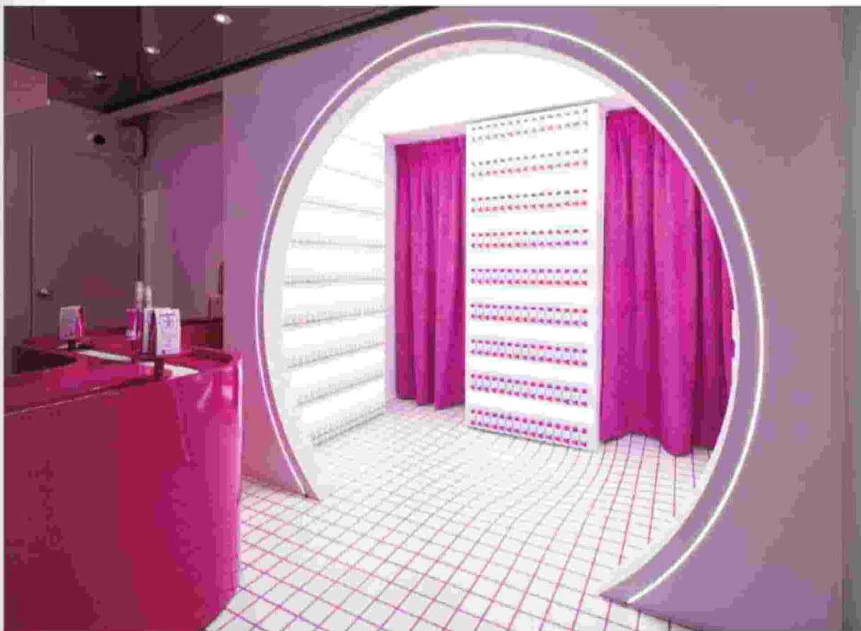
FLAGSHIP STORE VERALAB MILANO