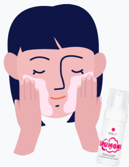
SUBITO DOPO SPALMATE SPUMONE SOPRA OLIO DENSO E MASSAGGIATE NUOVAMENTE