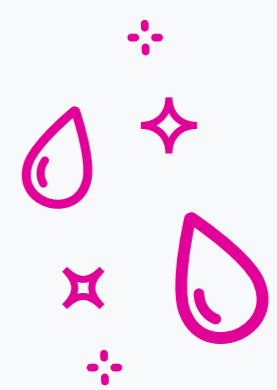
RISCIACQUO CON ACQUA TIEPIDA