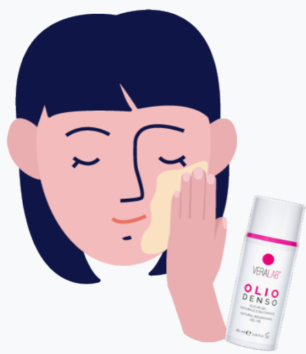
SPALMATE OLIO DENSO SUL VISO ASCIUTTO MASSAGGIANDO NELLE ZONE CON PIU' IMPURITÀ