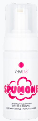
SPUMONE DETERGENTE SCHIUMOGENO