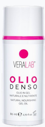
OLIO DENSO DETERGENTE OLEOSO