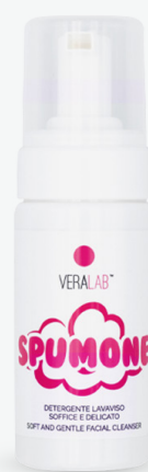
Spumone Detergente schiumogeno