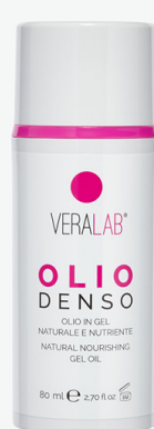
Olio Denso Detergente oleoso