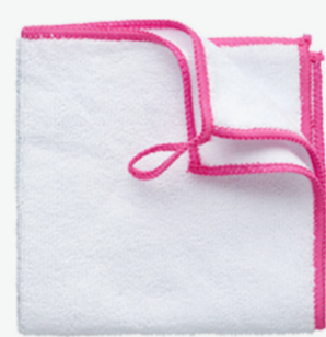
Panno in microfibra