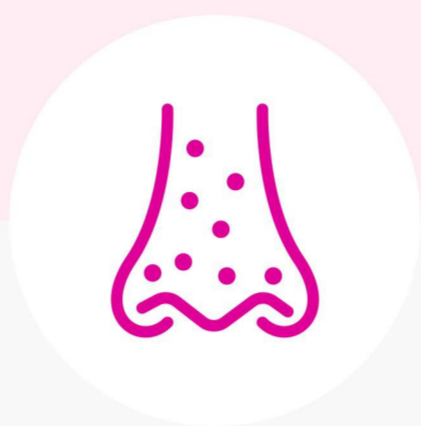
Grassa nella zona T