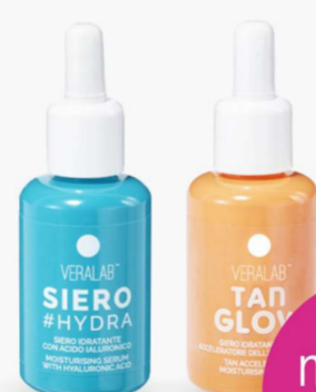
Siero #Hydra Siero Tan Glow