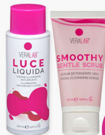
Luce Liquida Smoothy Scrub