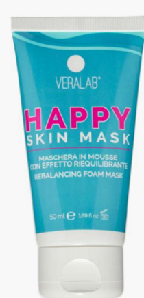
Happy Skin Mask