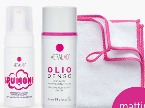
Spumone Olio Denso + panno