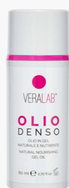
Olio Denso Detergente oleoso