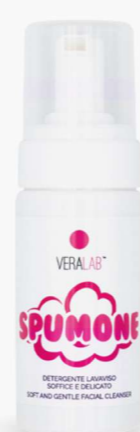
Spumone Detergente schiumogeno