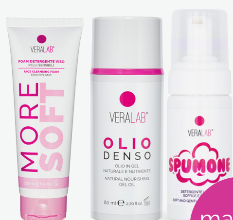
More Soft Olio Denso + Spumone