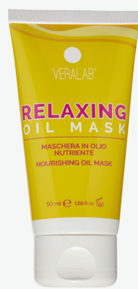
Relaxing Oil Mask